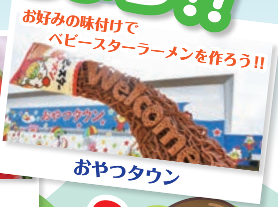
お好みの味付けで ベビースターラーメンを作ろう!!